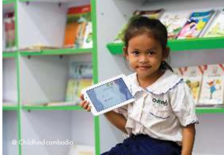
@ Childfund cambodia

បញ្ហាប្រឈមថ្មីៗទាំងនេះមិនមែនឆ្លុះបញ្ចាំងពីបរាជ័យ ឬកង្វះ វឌ្ឍនភាពឡើយ ប៉ុន្តែឆ្លុះបញ្ចាំងពីបញ្ហាប្រឈមជាបន្តបន្ទាប់ ដែលប្រទេសជាតិទាំងអស់ជួបប្រទះ ក្នុងកិច្ចខិតខំប្រឹងប្រែង សម្រេចឲ្យបាននូវកំណើនសេដ្ឋកិច្ចក្របកបដោយចីរភាព នៅក្នុង បរិបទដែលមានការផ្លាស់ប្តូរយ៉ាងលឿន។