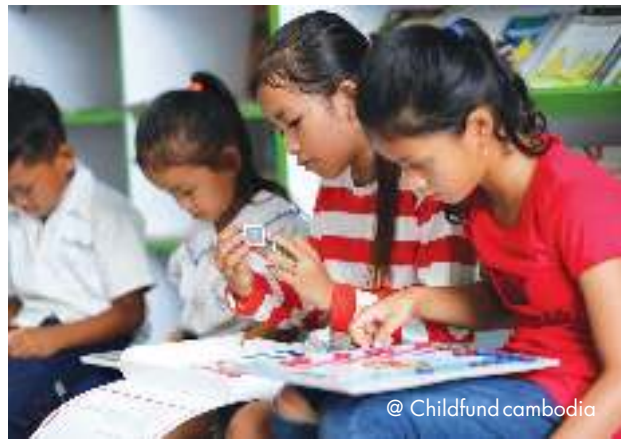
@ Childfund cambodia